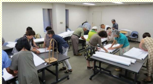
松江水燈路 行灯づくり